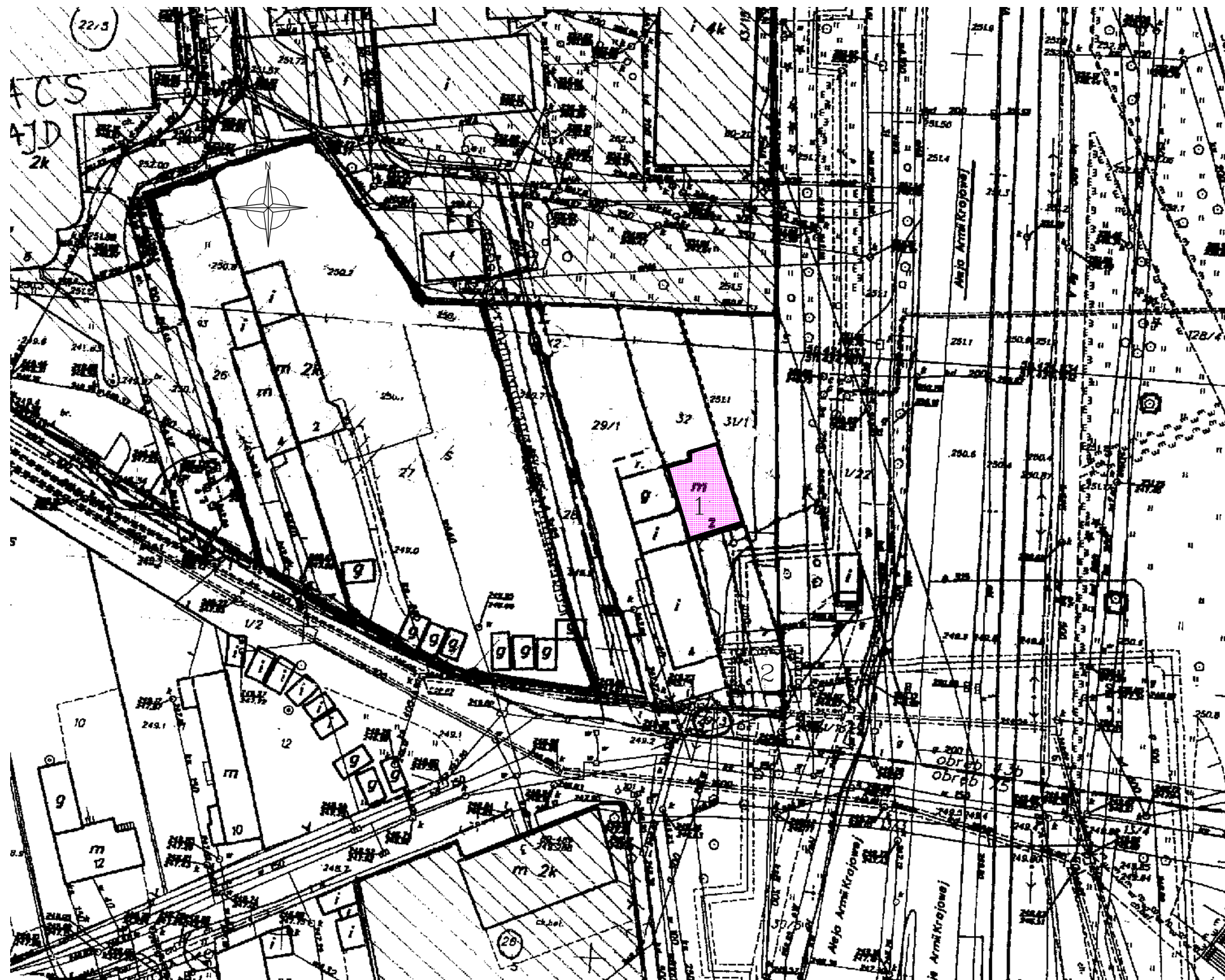
ORIENTACJA 1:20 000